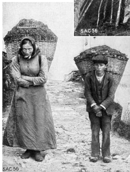
Abbildung 3: Frau und Knabe mit gefüllten Chris-Tschifferen (Eggwald, Zeneggen, STEBLER 1922, S. 98).