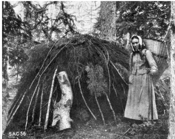
Abbildung 2: Tristenartiger Waldstreuhaufen mit Deckholzschicht in den Vispertaler Sonnenbergen (Wallis): Frau mit Chris-Tschifferen (Eggwald, Zeneggen, STEBLER 1922, S. 99).

frorenen Erde in Tüchern auf Ästen zu den Schlitten und mit diesen zu den Ställen gezogen. Andernorts wurde die Waldstreu unter Dach zwischengelagert, so in Uri in so genannten «Streiwi-Stadeln», einem balkonähnlichen Ausbau unter dem Gadendach, im Fieschertal (Wallis) in einem angebauten Verschlag und im Berner Oberland in eigentlichen Streuhütten an den Waldrändern. 11 Für diese letzte Region sind zwei weitere Besonderheiten überliefert. Die Waldstreu wurde von Frauen und Kindern nicht nur im Herbst und im Frühling, sondern das ganze Jahr über «an den trockenen Stellen der Nadelwälder auf Felsen und Wegen zusammengeschartt und im Tragkorb gesammelt». Auf den Vorfrühling beschränkt war dagegen die Nutzung der grossen Ameisenhaufen, die man sorgfältig abhob, «bevor die Ameisen im oberen Stock sind». 12