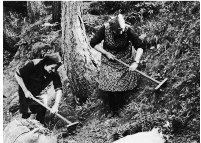
Abbildung 1: Saaser Frauen kratzen Nadel- und Krautstreue mit Adlerrechen zusammen (um 1975, Werner Imseng, Marienhof, Saas-Fee – repr. in RUPPEN et al. 1988).

Grundsätzlich sind drei Arten von Waldstreue zu unterscheiden. 5 Die Rechstreue (auch Bodenstreue genannt) gewann man je nach der örtlichen Baumartenzusammensetzung aus den abgefallenen Nadeln von Fichten, Weisstannen, Lärchen, Arven oder Föhren bzw. dem Laub von Buchen, Ahornen, Kastanien, Eichen und Linden, die Schneitelstreue (auch Aststreue) aus den abgeschlagenen kleineren Zweigen von Na-