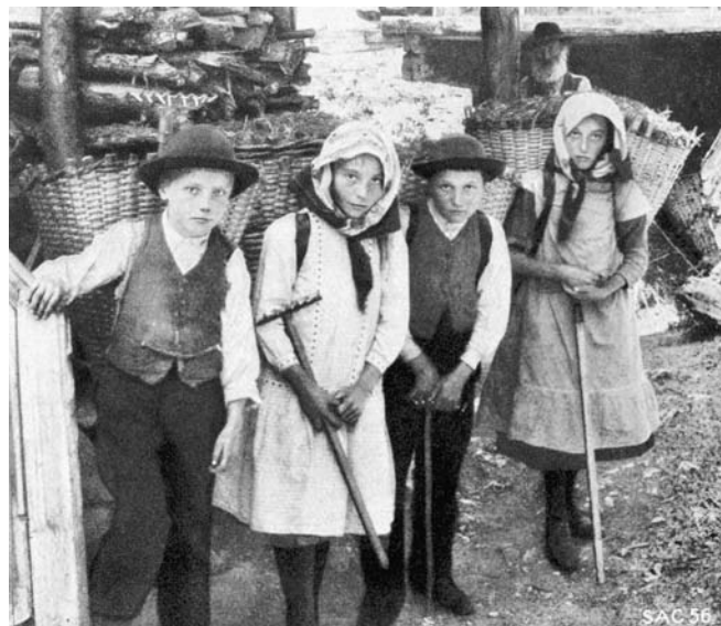
Abbildung 4: Knaben und Mädchen mit gefüllten Chris-Tschifferen (Eggwald, Zeneggen, STEBLER 1922, S. 103).